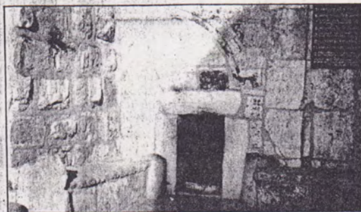
Cueva de la Natividad.