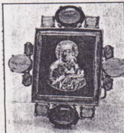
Pequeño cuadro de la Virgen y el niño Dios

Las Piedras de la Natividad han sido puestas en cruces, adornos y