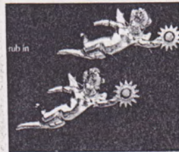
Broche del Angel Guardián